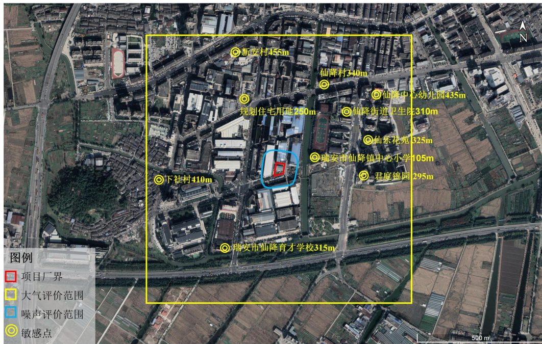
图 3-1 环境保护目标示意图